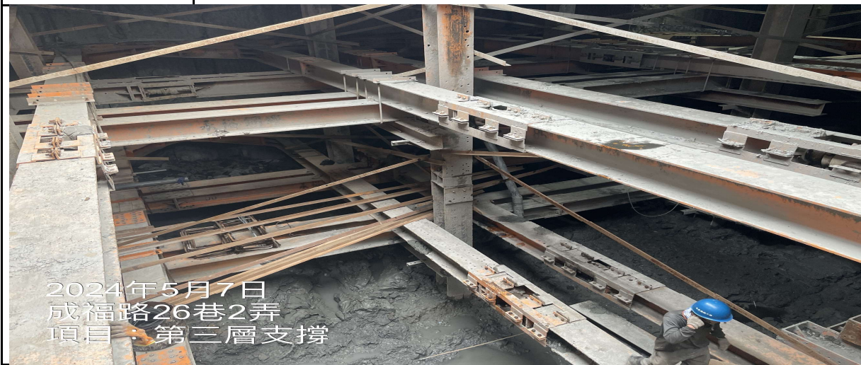
工程名稱: 第三層支撐施作