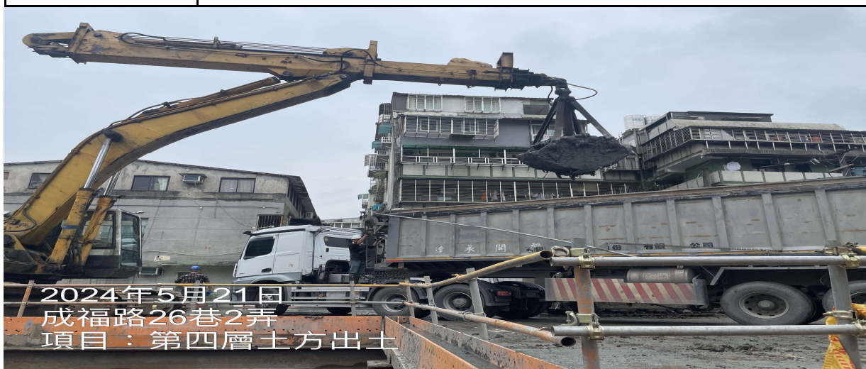
工程名稱: 第四層土方出土